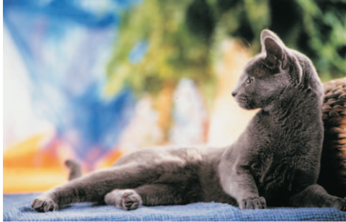
Körper Lang, schlank und elegant

Nur ein strenges Zuchtprogramm hat es ermöglicht, daß diese Zuchtkatze in der ursprünglichen Form überleben konnte.